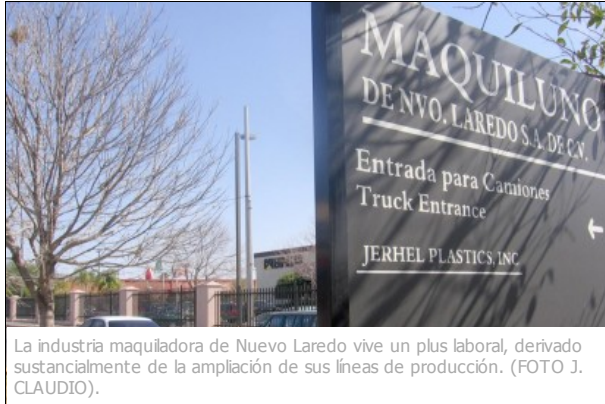
La industria maquiladora de Nuevo Laredo vive un plus laboral, derivado sustancialmente de la ampliación de sus líneas de producción. (FOTO J. CLAUDIO).

Martes 04 de Septiembre del 2012 Por: Javier Claudio Gamez 19:58 Hrs.